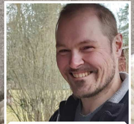
Onnettomuuden jälkeen hengissä